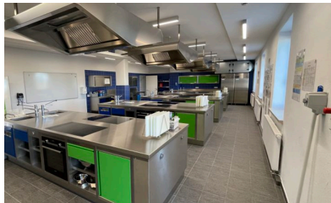
Moderne Lehrküche für nachhaltige Ernährungs- und Verbraucherbildung