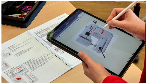
Digitale Werkzeuge sind Alltag im Fachunterricht

Weitere und ausführliche Informationen zum Fach finden Sie hier: